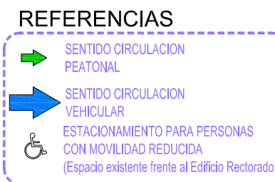
DET-01 Esc. 1.20